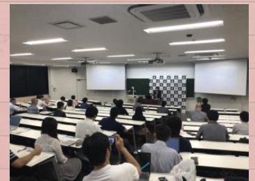
2019年一般講座の様子